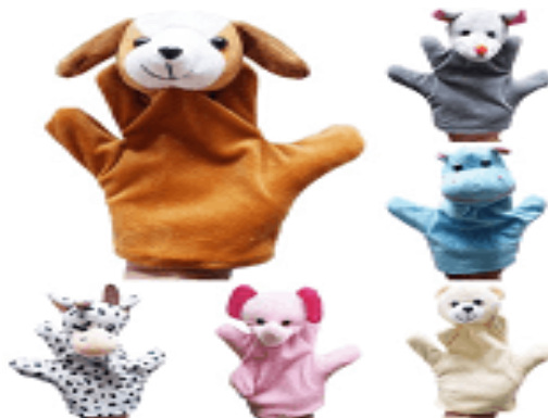
Gambar 1.1 Boneka Tangan

Dalam penelitian ini, yang dimaksud dengan boneka tangan adalah bentuk tiruan dari manusia dan binatang yang dapat digerakkan dengan tangan atau jari tangan. Dalam hal ini, Ekasriadi (2005) menyebutkan bahwa boneka pada dasarnya memiliki karakteristik khusus, dalam penggunaannya dimanfaatkan sebagai media pembelajaran dengan media boneka tangan. Lebih lanjut dikatakan pula bahwa, cara menggerakkan dengan jari-jari tangan seperti yang dipakai pada boneka Si Unyil. Salah satu contoh bentuk boneka tangan seperti ditunjukkan dalam gambar berikut ini.