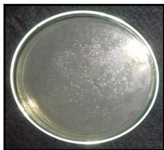
Gambar 2. Candida albicans pada media SDA

daya 650 W, dan kelompok C1 adalah kelompok yang didesinfeksi dalam larutan sodium hipoklorit 0,5% selama 10 menit. Selanjutnya cetakan dibilas kembali dengan air mengalir lalu dikeringkan. Permukaan cetakan kemudian di swab menggunakan cotton swab dan ditransfer ke tabung reaksi yang berisi larutan phosphate buffer saline . Tabung reaksi kemudian digetarkan selama 30 detik untuk melepaskan Candida albicans yang lengket pada cotton swab . Sebanyak 100 µl phosphate buffer saline yang berisi Candida albicans ditransfer ke dalam cawan petri steril lalu tuangkan sabouraud dextrose agar (SDA) yang telah dicairkan ke dalam cawan petri dan diamkan hingga mengeras. Masukkan cawan petri ke dalam inkubator dan diinkubasi selama 24 jam pada suhu 37°C. Setelah itu baru dilakukan penghitungan jumlah Candida albicans menggunakan alat colony counter (Gambar 2).