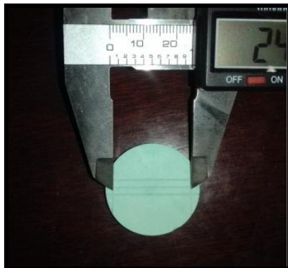
Gambar 3. Pengukuran jarak antar dua takik vertikal pada model kerja

Untuk pengukuran stabilitas dimensi. Cetakan yang diperoleh dibagi atas 3 kelompok, kelompok A2 adalah kelompok yang tidak diberi perlakuan, kelompok B2 adalah kelompok yang didesinfeksi dengan microwave selama 5 menit dengan daya 650 W, dan kelompok C2 adalah kelompok yang didesinfeksi dalam larutan sodium hipoklorit 0,5% selama 10 menit. Selanjutnya cetakan dibilas dengan air mengalir lalu dikeringkan dan didiamkan selama 30 menit. 12 Seluruh cetakan kemudian diisi dengan gips keras tipe IV di atas vibrator dan dibiarkan setting selama 2 jam sebelum dikeluarkan dari cetakan dalam bentuk model kerja dan dilakukan pengukuran dimensi menggunakan kaliper digital (Gambar 3).