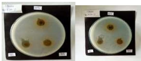
Gambar 3 Hasil zona hambat pada ekstrak daun salam ( Syzygium polyanthum ) konsentrasi 50%, 75% dan 100% - kitosan nanopartikel 1% terhadap bakteri Streptococcus mutans .

Selanjutnya, dilakukan analisa data menggunakan uji korelasi Pearson , hasil pengukuran uji korelasi Pearson selengkapnya dapat di perhatikan pada tabel 5 di bawah ini.