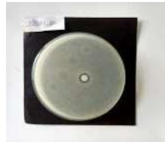
Gambar 1 Hasil zona hambat kontrol positif Kitosan nanopartikel 1% terhadap bakteri Streptococcus mutans .

Berdasarkan data uji statistik one way ANOVA pada tabel 4 diatas menunjukkan bahwasanya hasil signifikansi p=0,000 ( p<0,05 ). Berdasarkan hasil ini terdapat efek antibakteri nanopartikel kitosan 1% dan ekstrak daun salam ( Syzygium polyanthum ) terhadap perkembangan bakteri Streptococcus mutans .