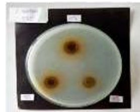
Gambar 2 Hasil zona hambat kontrol positif ekstrak daun salam ( Syzygium polyanthum ) konsentrasi 50%, 75% dan 100% terhadap bakteri Streptococcus mutans .