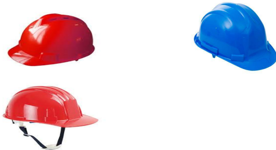
Gambar 2.1. Alat Pelindung Kepala

alat pelindung kepala terdiri dari helm pengaman ( safety helmets ), topi atau tudung kepala, penutup atau pengaman rambut dan I