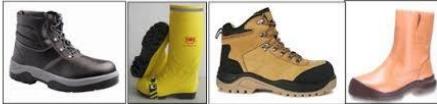
Gambar 2.5. Alat Pelindung Kaki

peledakan, bahaya listrik, tempat kerja yang basah atau licin, bahan kimia dan jasad renik atau bahaya binatang dan lain – lain.