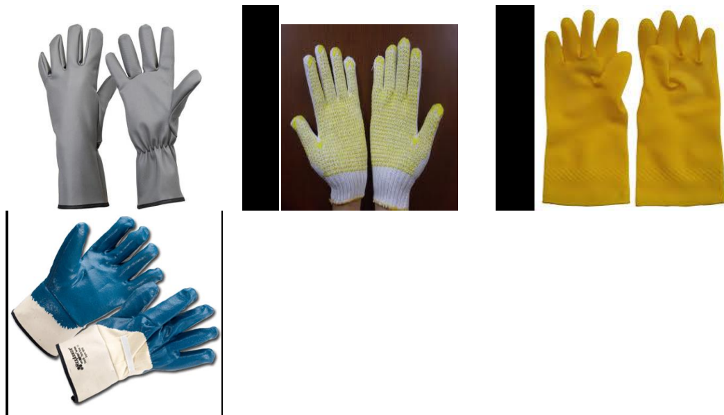
Gambar 2.4. Alat Pelindung Tangan

Macam – macam sarung tangan menurut bahaya yang harus dicegah: