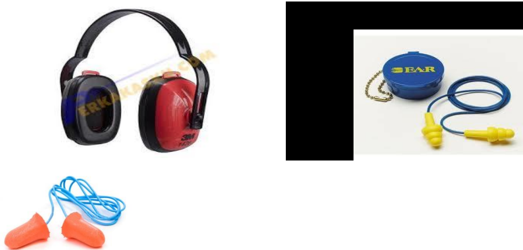
Gambar 2.2. Alat Pelindung Telinga