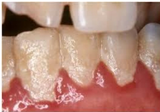
Gambar 2.2 Debris

Debris adalah sisa makanan yang menempel pada permukaan gigi, celah gigi dan merupakan faktor pendukung timbulnya kalkulus maupun karies. Secara fisiologis debris dapat dibersihkan dengan aliran saliva dan pergerakan otot-otot rongga mulut pada saat proses penguyahan. Selain itu ada cara lain seperti berkumur, flossing (menggunakan benang gigi), menguyah permen karet, menghindari makanan yang mengandung sukrosa, dan memperbanyak mengkonsumsi buah – buahan dan sayur- sayuran yang berserat dan berair. Jika debris bertumpuk dan tidak dibersihkan akan menimbulkan kalkulus (Prasko, 2012).