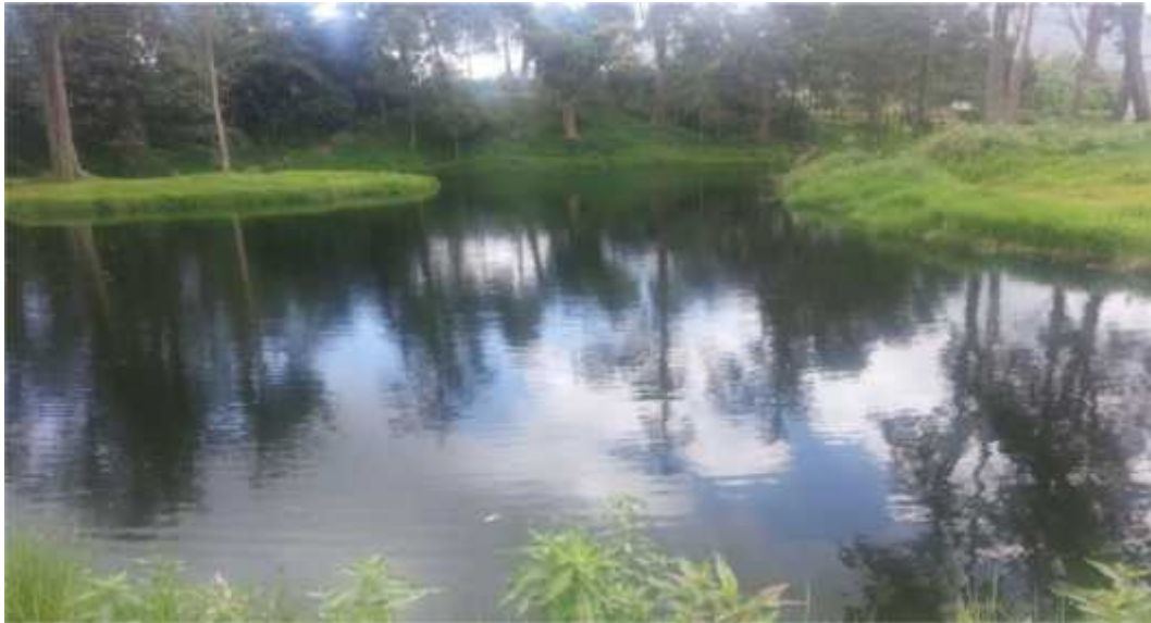
Gambar 1 : Mata Air Perlindungan Desa Kutarayat