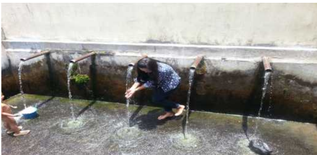
Gambar 3 : Sumber pencemar Perlindungan Mata Air